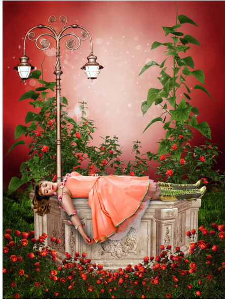
Dornröschen © Martin Hesz

Download unter http://www.maerchensommer.at/stmk/presse.html