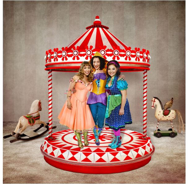
Märchenkarussell © Martin Hesz