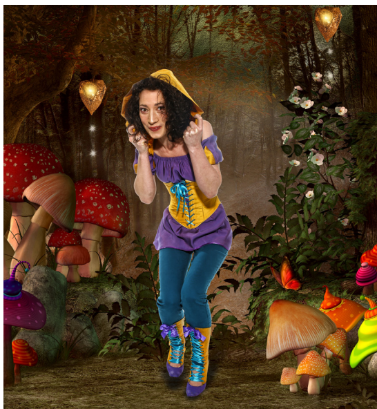
Schneewittchen © Martin Hesz