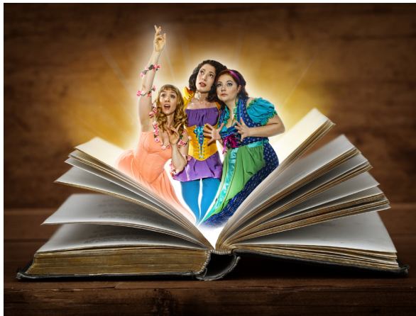
Märchenkarussell © Martin Hesz